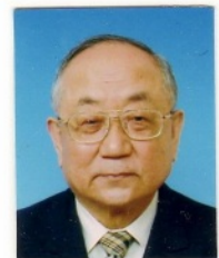
(昭和三十九年法卒)

す。国の検定教科書が変わったのです。早く認めた訳です。改訂は意外と早かったですね。また、今年発行された受験参考書には、「厩戸王」の次に「弧して（聖徳太子と言われた人）」と記しているものもあります。実は、「超人的な厩戸王即ち聖徳太子」はいなかったのです。が、「普通の人である厩戸王」はいたのです。スーパーマンではなく普通の人がいたのです。理由等、詳細はぜひ上記の本をお読み下さい。