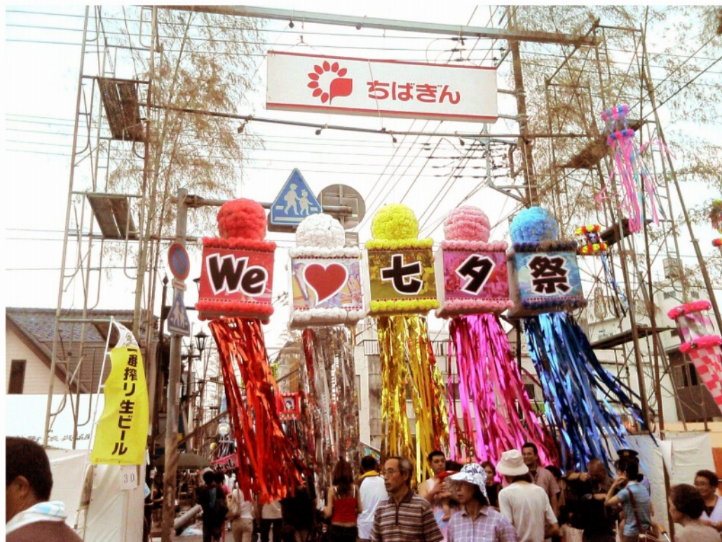
今年の茂原七夕祭り