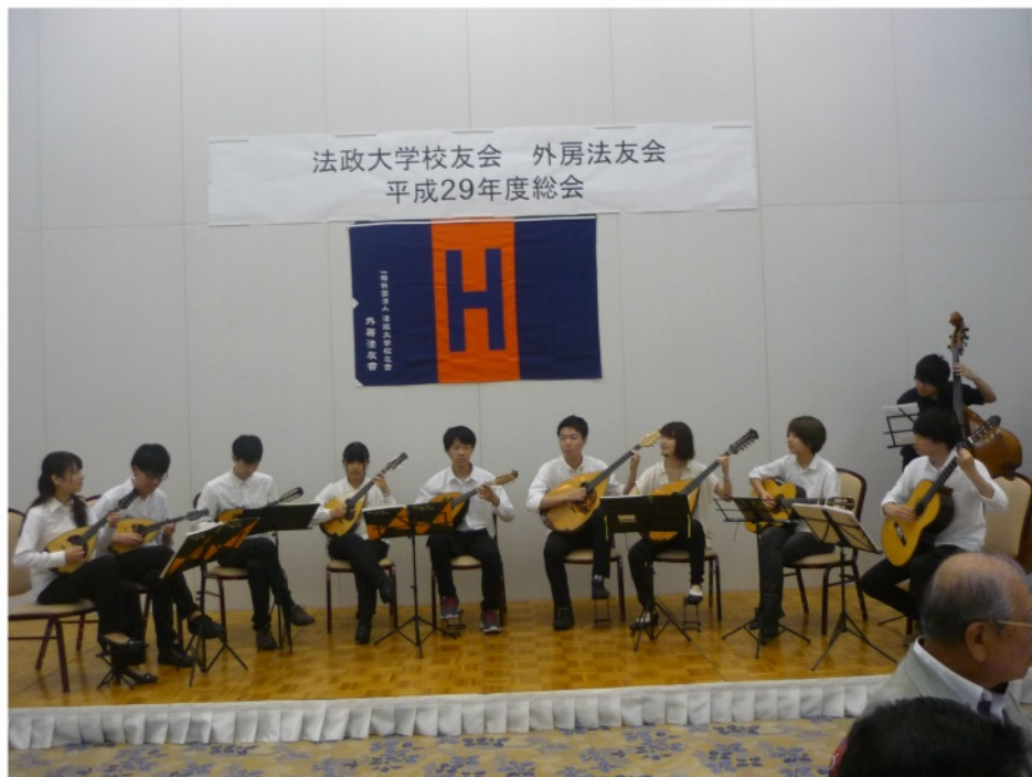
法政大学マンドリンクラブの学生による演奏

平成29年度外房法友会の総会を、平成29年7月1日（土）長生郡一宮町の「ホテル一宮シーサイドオーツカ」にて開催しました。