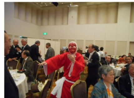
会場を回るひよつとこ踊り