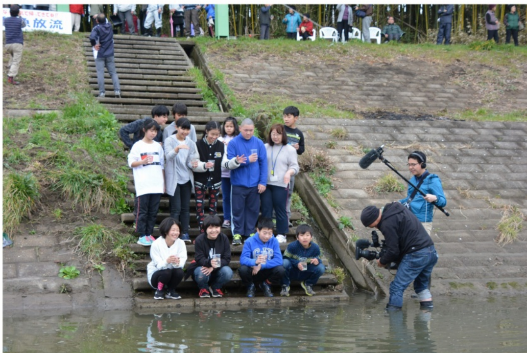
瑞沢川に鮭を放流する小学生

今年で8回を迎えた鮭の稚魚放流は3月5日。6000匹を300人の人達と行き、マスコミにも取り上げられました。10月にはNHK FM放送、11月と3月には朝日新聞、千葉日報、NHK TVと今まで以上に取り上げて頂きました。